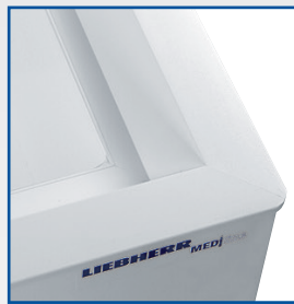
Isolation polyuréthane haute densité épaisseur 100 et 120 mm pour une consommation d'énergie réduite.