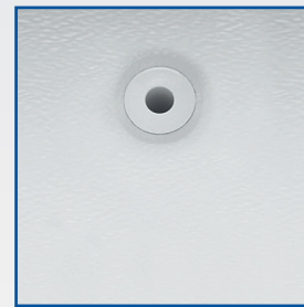
Passage de cuve Ø 10mm pour sonde GTC (Gestion Température Centralisée) PT100.