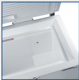
Froid statique haute performance avec refroidissement périphérique de la cuve sur les 5 faces.