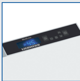
Régulation électronique Comfort (voir détail)