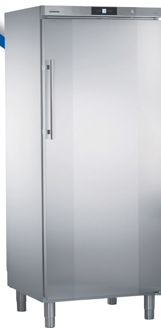
GKv 7160 x