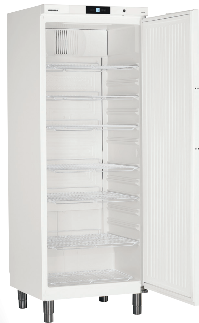
GKv 7110 X